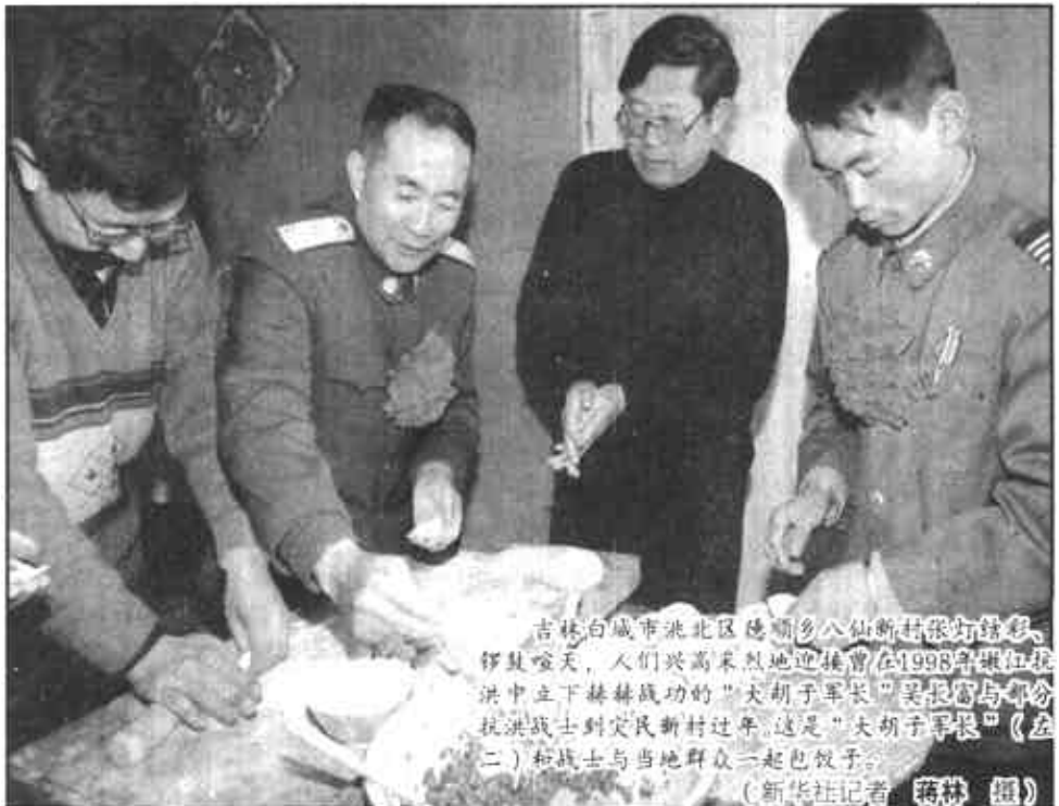
吉林白城市洮北区德惠乡多仙新村张灯结彩，锣鼓喧天，人们兴高采烈地迎接在1998年抗洪中立下赫赫战功的“天河”号长堤“英雄连”官兵凯旋。战士们与当地群众一起包饺子。