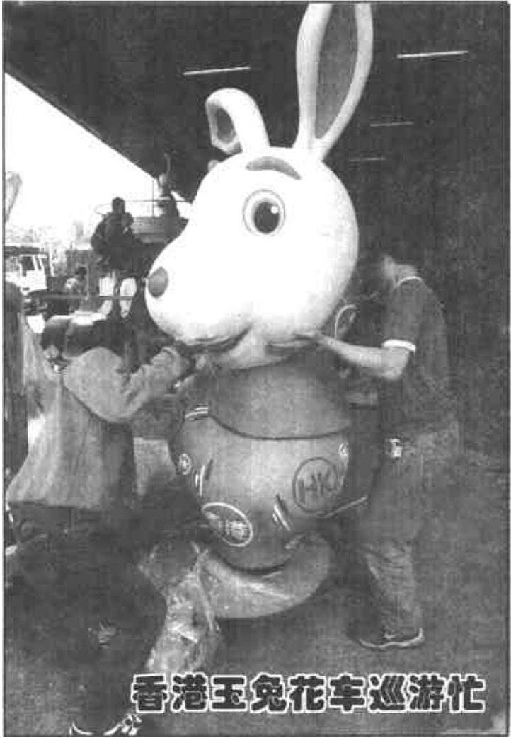
香港玉兔花车巡游忙

新华社北京2月14日电 首都春节联欢文艺晚会今晚在人民大会堂举行。中共中央政治局常委、国家副主席胡锦涛，中共中央政治局常委、书记处书记尉健行，中共中央政治局常委、国务院副总理李岚清等中央领导同志与首都万多名观众欢聚一堂，喜迎新春。 今晚的人民大会堂到处洋溢着喜庆欢乐的节日气氛。人民大会堂的前厅张灯结彩，悬挂着盏盏红灯笼和“春”字幅。木偶戏和大型充气游戏模型“飞渡铁索桥”等吸引了许多儿童。二楼宴会厅里，伴随着欢乐的舞曲，人们翩翩起舞。为欢度兔年新春，三楼小礼堂举行了京剧专场演出，吸引了众多的京剧爱好者。 今天文艺晚会形式多样，异彩纷呈，自始至终充满欢声笑语，荡漾着喜庆祥和的欢乐气氛。京剧联唱《贺新春》拉开了文艺演出的序幕。独唱《知识就是力量》、《中华颂》、《共和国之恋》、《好日子》、《兵之歌》、《中华满堂红》等，或高亢雄浑，或抒情优美，对祖国和未来抒发了节日的祝愿；舞蹈《欢乐的摆摆》、杂技《玉兔送福闹新春》等，展现了中国传统艺术的魅力，赢得了观众阵阵掌声。