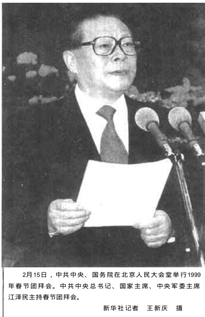
2月15日，中共中央、国务院在北京人民大会堂举行1999年春节团拜会。中共中央总书记、国家主席、中央军委主席江泽民主持春节团拜会。

朱镕基讲话 李鹏李瑞环胡锦涛尉健行李岚清等出席 江泽民主持 代表中共中央国务院向全国人民祝贺新春